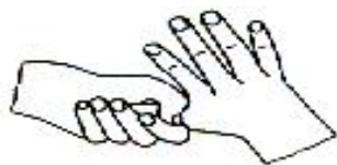
5. 拇指在掌中转动搓擦