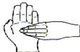
6. 指尖在掌心中搓擦